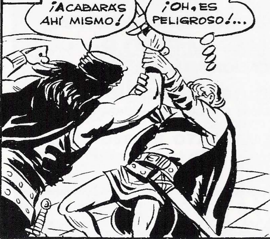
A DURAS PENAS LOGRA CONTENER A SU CONTRARIO QUE BUSCA UN FINAL RÁPIDO.