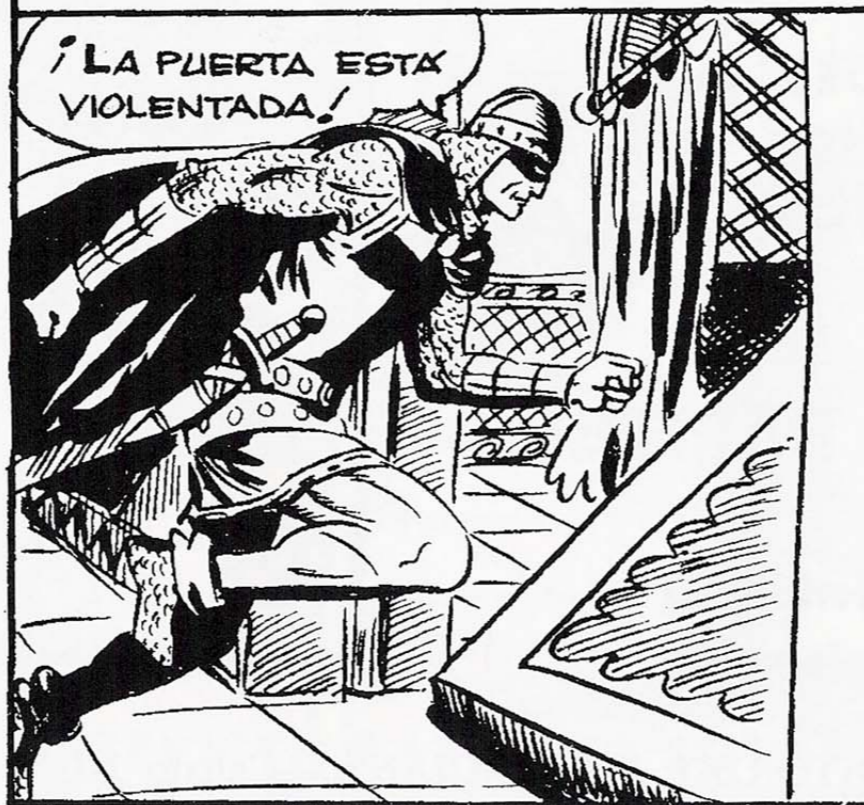
EL GUERRERO CORRE POR UN PASILLO Y ENTRA EN EL APOSENTO DE KURKAF