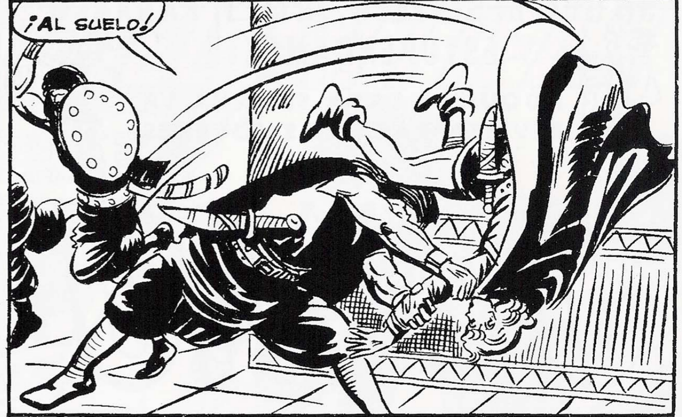
... MAS EL JOVEN CABALLERO SE VE SORPRENDIDO Y VOLTEADO.