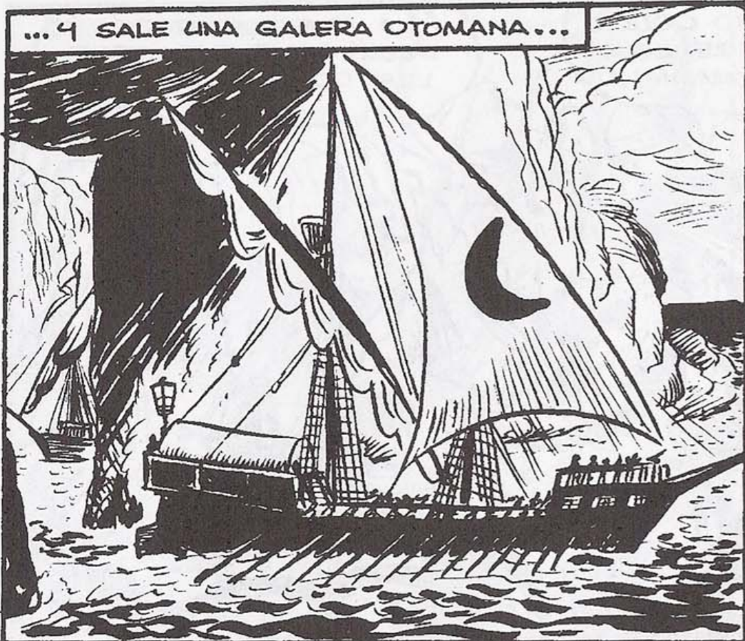
... Y SALE UNA GALERA OTOMANA...