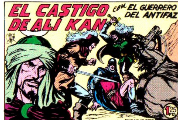
PORTADA DEL NUMERO 300