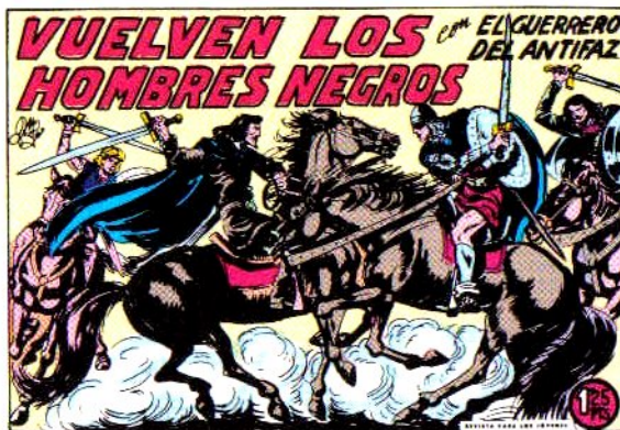
PORTADA DEL NUMERO 299

PORTADAS ORIGINALES DE LOS CUADERNOS IN- CLUIDOS EN EL INTERIOR.