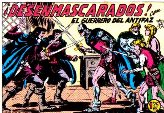
PORTADA DEL NUMERO 298

PORTADAS ORIGINALES DE LOS CUADERNOS IN- CLUIDOS EN EL INTERIOR.