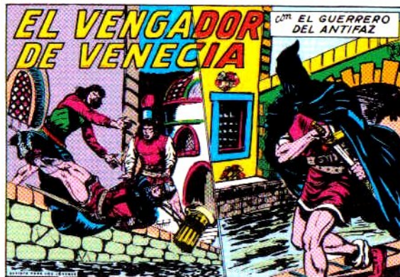
PORTADA DEL NUMERO 302