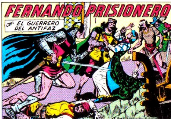
PORTADA DEL NUMERO 301