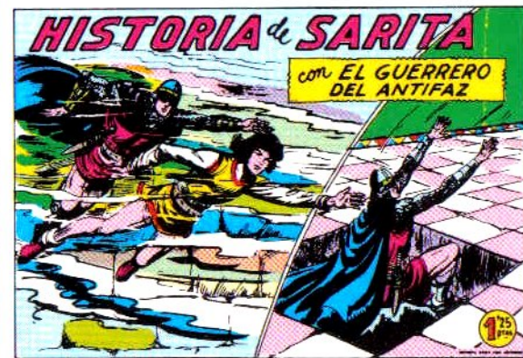
PORTADA DEL NUMERO 303