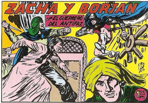
PORTADA DEL NUMERO 272