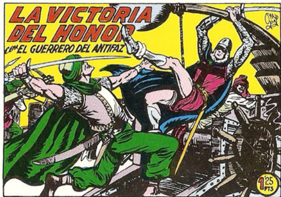
PORTADA DEL NUMERO 271

PORTADAS ORIGINALES DE LOS CUADERNOS IN- CLUIDOS EN EL INTERIOR.