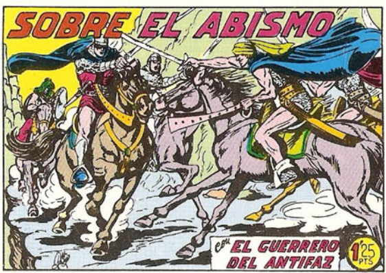
PORTADA DEL NUMERO 273