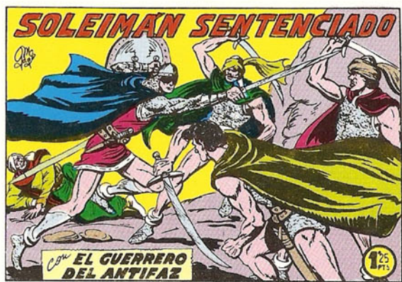
PORTADA DEL NUMERO 274