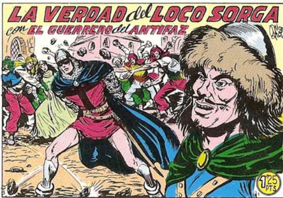
PORTADA DEL NUMERO 270

PORTADAS ORIGINALES DE LOS CUADERNOS IN- CLUIDOS EN EL INTERIOR.