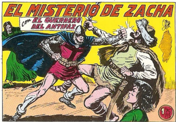
PORTADA DEL NUMERO 275