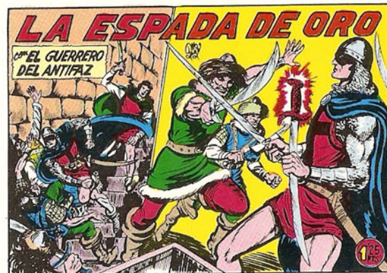
PORTADA DEL NUMERO 266