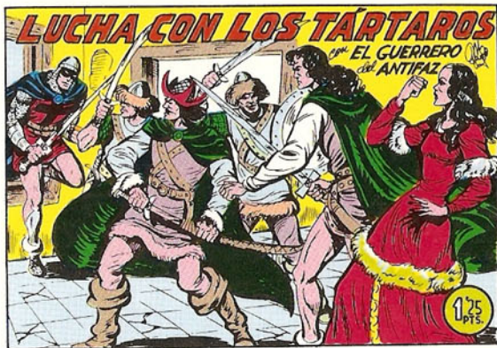
PORTADA DEL NUMERO 263

PORTADAS ORIGINALES DE LOS CUADERNOS IN- CLUIDOS EN EL INTERIOR.