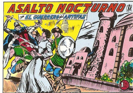
PORTADA DEL NUMERO 265