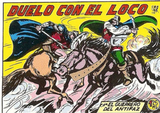
PORTADA DEL NUMERO 264

PORTADAS ORIGINALES DE LOS CUADERNOS IN- CLUIDOS EN EL INTERIOR.