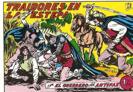
PORTADA DEL NUMERO 268