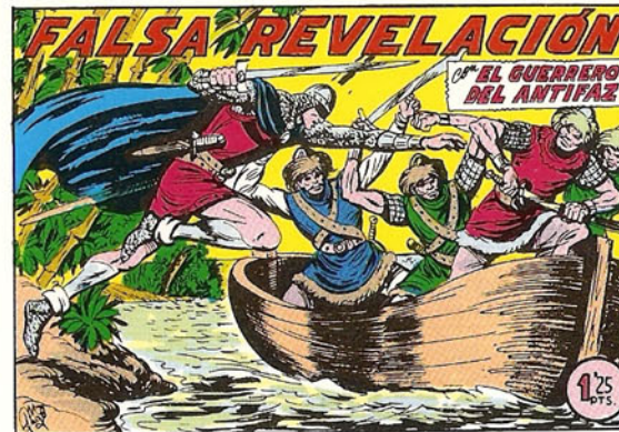
PORTADA DEL NUMERO 267