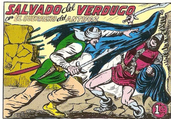
PORTADA DEL NUMERO 230