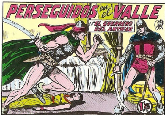
PORTADA DEL NUMERO 228