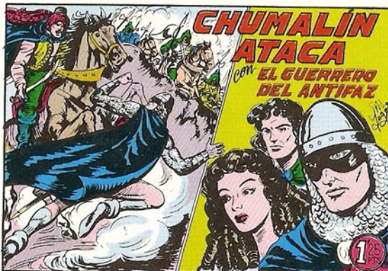
PORTADA DEL NUMERO 229

PORTADAS ORIGINALES DE LOS CUADERNOS IN- CLUIDOS EN EL INTERIOR.