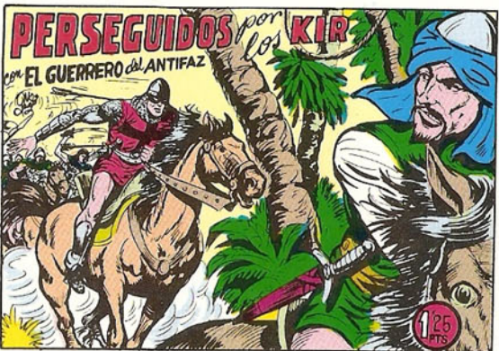
PORTADA DEL NUMERO 231

PORTADAS ORIGINALES DE LOS CUADERNOS IN- CLUIDOS EN EL INTERIOR.