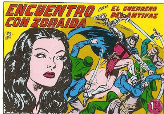
PORTADA DEL NUMERO 233