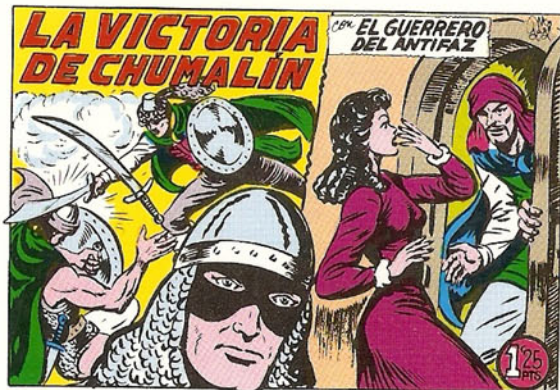
PORTADA DEL NUMERO 232