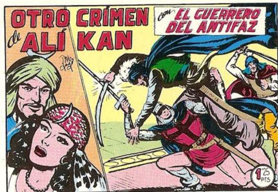
PORTADA DEL NUMERO 203