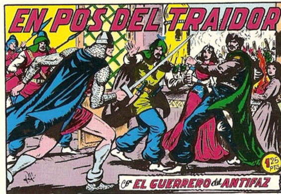
PORTADA DEL NUMERO 202