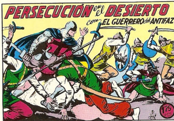
PORTADA DEL NUMERO 201

PORTADAS ORIGINALES DE LOS CUADERNOS IN- CLUIDOS EN EL INTERIOR.