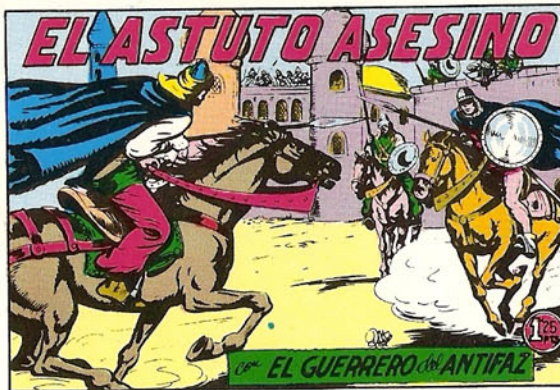
PORTADA DEL NUMERO 204