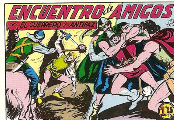
PORTADA DEL NUMERO 205