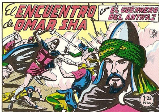
PORTADA DEL NUMERO 168