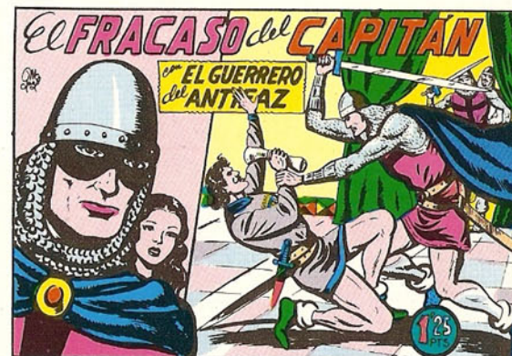
PORTADA DEL NUMERO 170