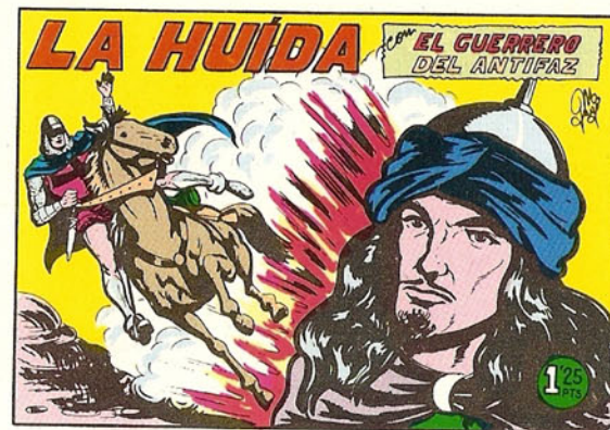
PORTADA DEL NUMERO 167