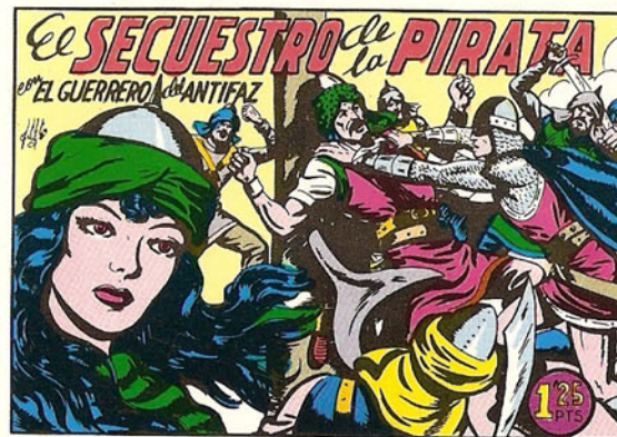
PORTADA DEL NUMERO 169