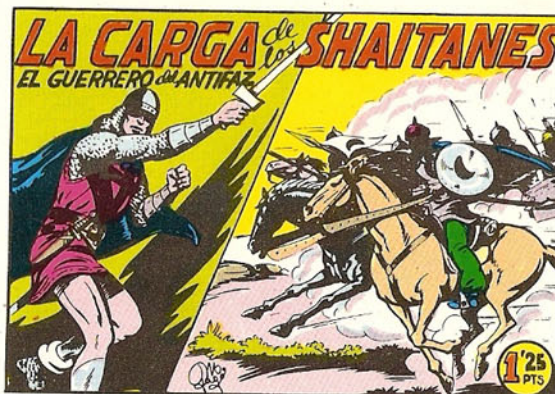
PORTADA DEL NUMERO 166

PORTADAS ORIGINALES DE LOS CUADERNOS IN- CLUIDOS EN EL INTERIOR.