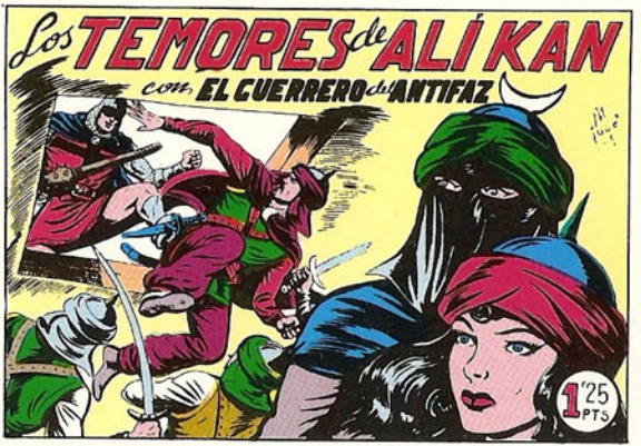
PORTADA DEL NUMERO 156