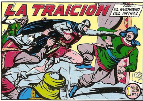
PORTADA DEL NUMERO 154