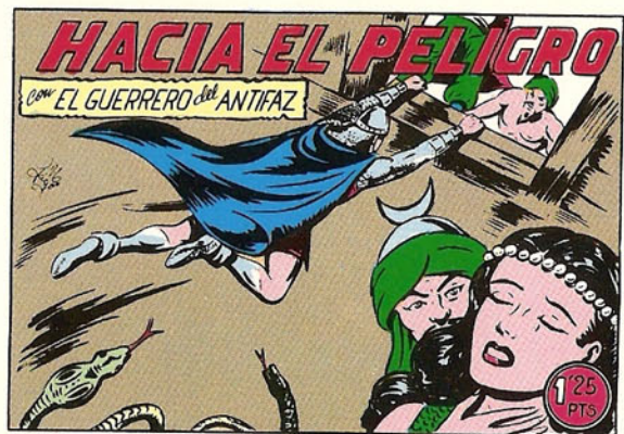
PORTADA DEL NUMERO 152

PORTADAS ORIGINALES DE LOS CUADERNOS INCLUIDOS EN EL INTERIOR.