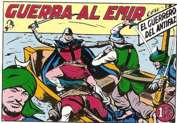
PORTADA DEL NUMERO 153