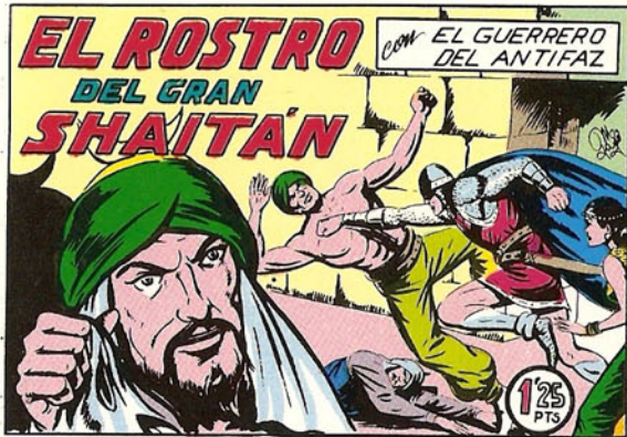
PORTADA DEL NUMERO 151

PORTADAS ORIGINALES DE LOS CUADERNOS INCLUIDOS EN EL INTERIOR.