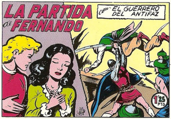
PORTADA DEL NUMERO 155