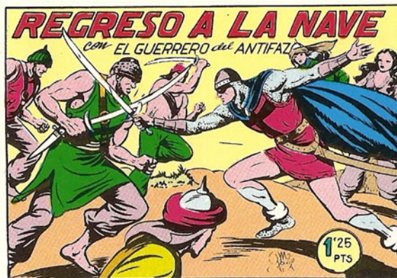
PORTADA DEL NUMERO 147