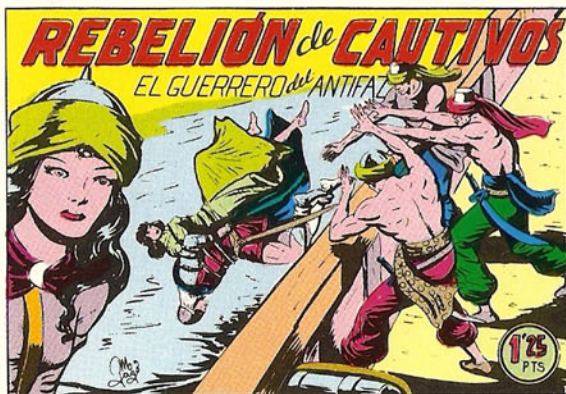
PORTADA DEL NUMERO 144

PORTADAS ORIGINALES DE LOS CUADERNOS IN- CLUIDOS EN EL INTERIOR.