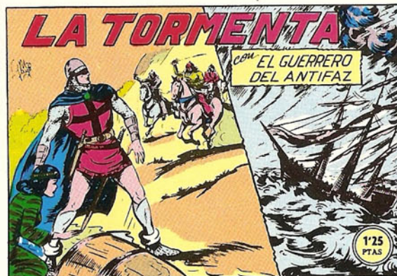
PORTADA DEL NUMERO 148