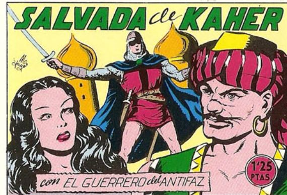
PORTADA DEL NUMERO 146