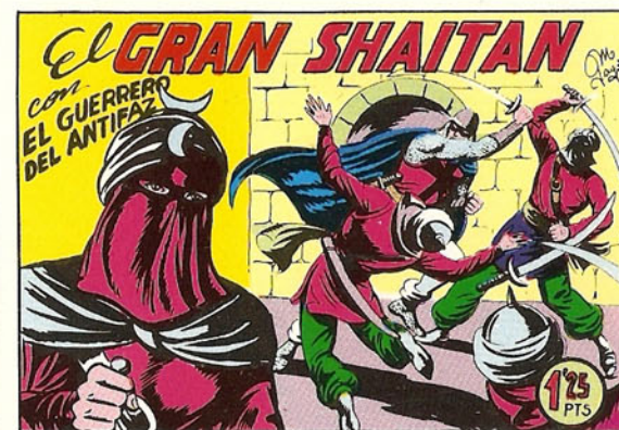
PORTADA DEL NUMERO 149