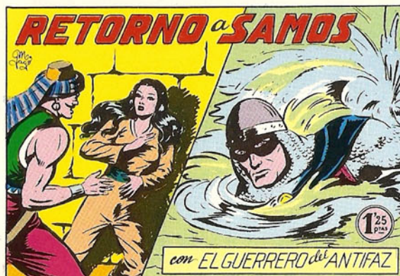
PORTADA DEL NUMERO 145

PORTADAS ORIGINALES DE LOS CUADERNOS IN- CLUIDOS EN EL INTERIOR.