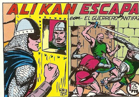
PORTADA DEL NUMERO 128