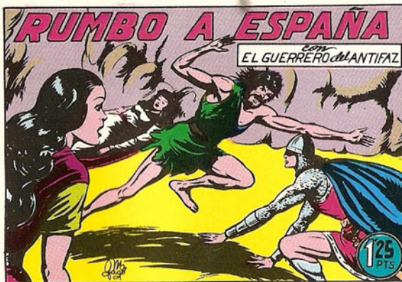
PORTADA DEL NUMERO 124

PORTADAS ORIGINALES DE LOS CUADERNOS IN- CLUIDOS EN EL INTERIOR.