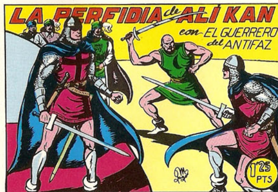
PORTADA DEL NUMERO 127