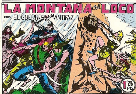
PORTADA DEL NUMERO 123