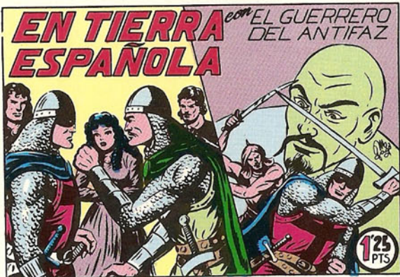
PORTADA DEL NUMERO 126

PORTADAS ORIGINALES DE LOS CUADERNOS IN- CLUIDOS EN EL INTERIOR.