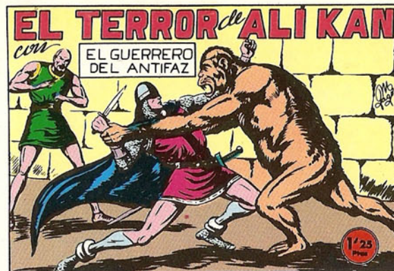
PORTADA DEL NUMERO 125