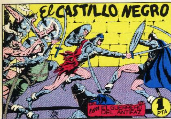
PORTADA DEL NUMERO 61