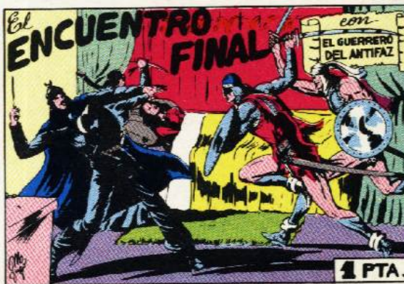
PORTADA DEL NUMERO 62