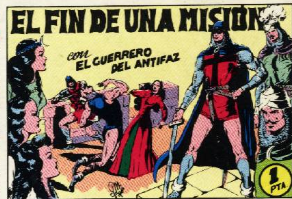
PORTADA DEL NUMERO 63