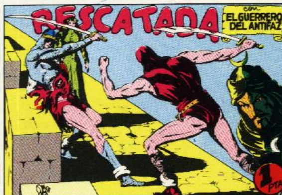
PORTADA DEL NUMERO 59

PORTADAS ORIGINALES DE LOS CUADERNOS IN- CLUIDOS EN EL INTERIOR.