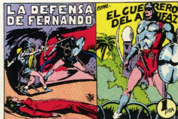
PORTADA DEL NUMERO 60