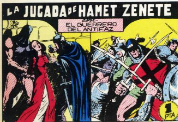
PORTADA DEL NUMERO 58

PORTADAS ORIGINALES DE LOS CUADERNOS IN- CLUIDOS EN EL INTERIOR.