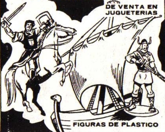
FIGURAS DE PLASTICO

El Cosaco Verde Karakan Ivan Sing-Li Sankara y sus ti- radores mongoles