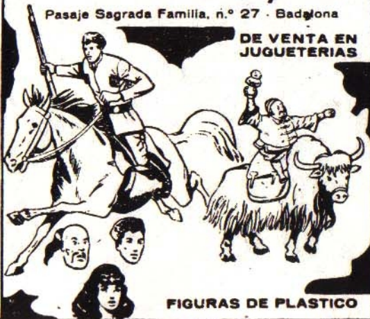
FIGURAS DE PLASTICO

¿LO SABIAS? * ¿LO SABIAS? * ¿LO SABIAS? ¿LO SABIAS? * ¿LO SABIAS? * ¿LO SABIAS? ¿LO SABIAS? * ¿LO SABIAS? * ¿LO SABIAS? ¿LO SABIAS? * ¿LO SABIAS? * ¿LO SABIAS?