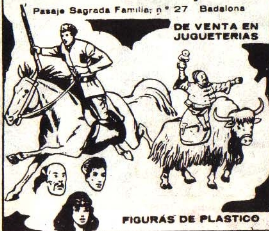
FIGURAS DE PLASTICO

¿LO SABIAS? * ¿LO SABIAS? * ¿LO SABIAS? La China era conocida antiguamente como el Imperio del Medio. Tal nombre se debía a la creencia de que el país constituía el centro del mundo conocido. También se la denominaba Celeste Imperio. El título con que se designaba a su emperador era el de Hijo del Cielo. Ese soberano tenía poder omnimodo y absoluto; sus mandarines y funcionarios ponían en su nombre, al pie de los documentos oficiales la fórmula: "Temblad y obedeced". ¿LO SABIAS? * ¿LO SABIAS? * ¿LO SABIAS? La fauna y la flora de la meseta del Pamir, llamado "el techo del mundo", son muy pobres a causa del clima. La ganadería se halla representada por el "yak", especie de buey de largo pelo, llamado "koutar", y por carneros salvajes de gran tamaño y nudosos cuernos curvados, conocidos por "arkars". La flora está constituida por álamos y enebros. En las charcas salobres crece el arbusto "artemisa". Es característica una planta enana conocida por "terskenne". ¿LO SABIAS? * ¿LO SABIAS? * ¿LO SABIAS?