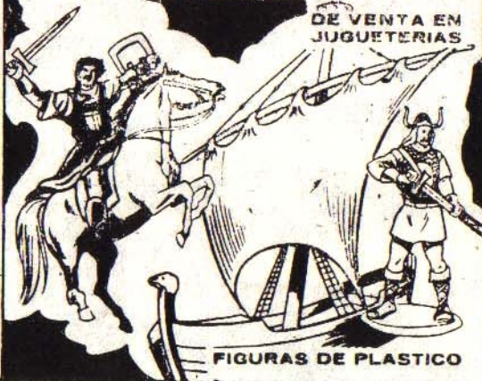
FIGURAS DE PLASTICO

El Cosaco Verde Karakán Iván Sing-Li Sankara y sus ti- radores mongoles Capitán Trueno Goliat Crispín Sigrid Juju Garritas Sarajak Unicornio Gundar y los vikings Jabato Taurus Claudia Fideo de Mileto