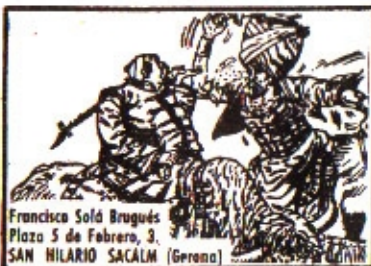
Francisco Solá Brugués Plaza 5 de Febrero, 3 SAN HILARIO SACALM (Gerona)