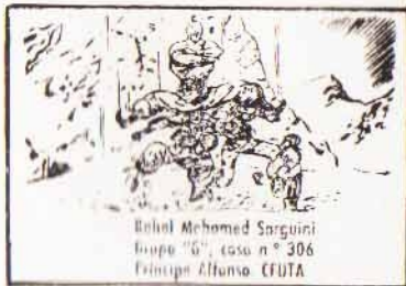
Bahad Mehomed Sarguini Grupo "G", casa n.º 306 Príncipe Alfonso. CEUTA